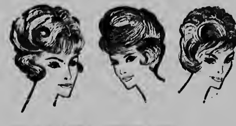
TUMA E PRUEBA CONVINCENTE

SI BO CABEI TA SECU, STIJF, DURU, LAS, VET, FINI O DIKI PERFORM TA GARANTIZA BO UN PEINADO DI ENSUENJO!